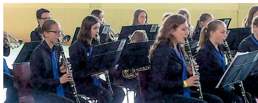
Das Wiggertaler Jugendblasorchester erspielte sich den dritten Rang.

Am 22. Juni 2015 um 18.30 Uhr lädt das Wiggertaler Jugendblasorchester alle Interessierten zur öffentlichen Probe in Reiden ein, wo unter anderem auch die Stücke von Sempach nochmals zum Besten gegeben werden. AW